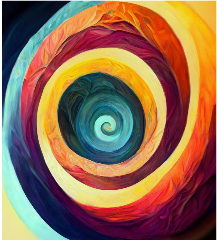
Spiralis , Kasmi Hafida©

Revue algérienne des lettres | Volume 7 | Numéro 2 | 2023