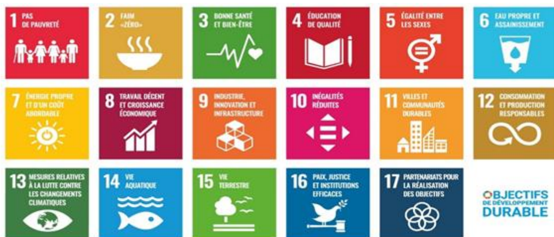
Schema1 : objectifs de développement durable