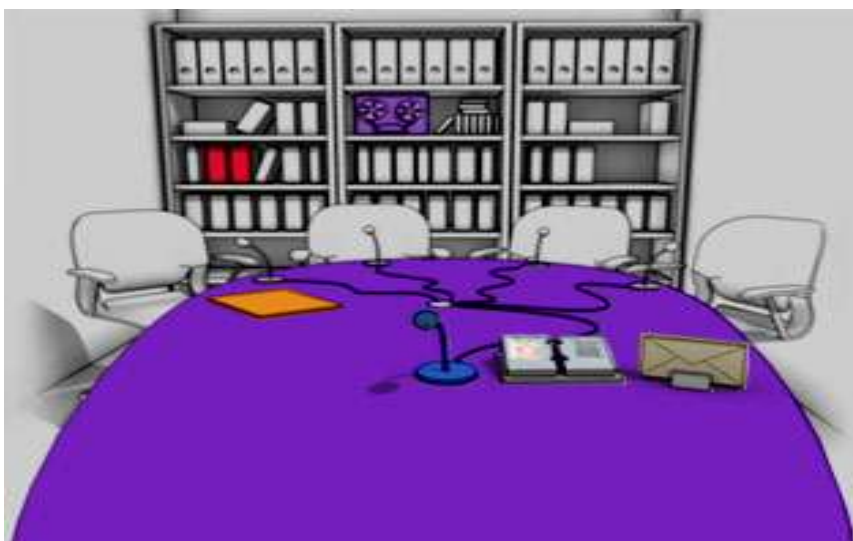
Figure 2 : Espace équipe

La plate-forme Acolad, exploitée dans le cadre d'une formation de Post graduation spécialisée, nous a servi d'environnement de travail. Parmi ses nombreuses fonctionnalités, nous avons opté pour les " espaces équipes " comportant des " Salons " pour discuter en mode synchrone et des forums pour discuter de façon asynchrone.