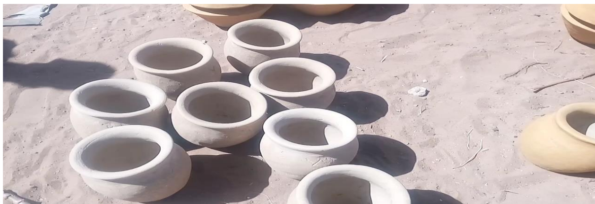
Photo n° 3 : les poteries pour les circoncis/ Sagatta, source : Ibrahima kh. Diagne 2017.

Ainsi, chaque poterie est remplie d'eau et d'amulettes dont les circoncis se purifient et l'ensemble de ces poteries sont systématiquement brisés sur la termitière. La lecture que l'on peut faire de ces cassures de poteries. Il s'agit l'opportunité aux circoncis de se dégager de toute malpropreté, des fardeaux mystiques néfastes. Exclusivement, cette purification rituelle a pour objectif de les protéger contre les mauvais yeux et les mauvaises langues quand ils retourneront au sein de la communauté sociale. Mieux un traditionnaliste à Touba Matal Bante, nous informe autrefois qu'on verse le reste de l'eau sous le plus grand et célèbre arbre 10 du village ou bien à la place mythique de celui-ci ( penc ). En réalité, l'explication que l'on peut extraire, est la prédication à des devenirs radieux aux circoncis à l'image de la grandeur et de la renommée de l'arbre. Au-delà de ces différentes étapes ponctuant la vie de l'individu, s'ensuit la mort. En ce sens, en milieu wolof peut-on enregistrer jusqu'à présent L'existence de la poterie dans les funérailles ?