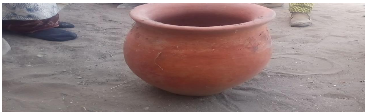
Photo 01 : Le vase « canari » symbole du mariage, source : Ibrahima Kh.Diagne, 2017.