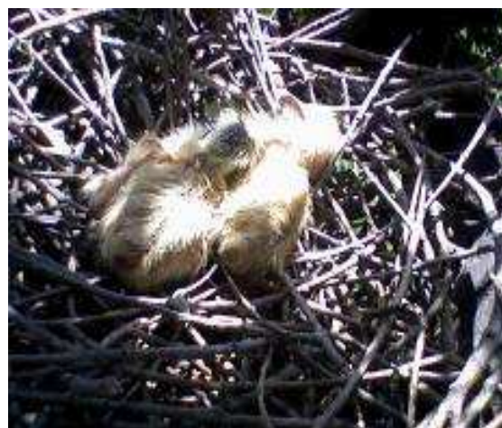
Fig. 4. Les poussins du Pigeon ramier Columba palumbus

Au stade poussin, le dernier facteur cité est la cause principale de la mort des oisillons (100 %, n = 3) (Fig. 4). Parmi les prédateurs, le chat domestique ( Felis catus ), le grand corbeau ( Corvus corax ), le faucon crécerelle ( Falco tinnunculus ) et la couleuvre fer-à-cheval ( Coluber hippocrepis ) sont à mentionner. Ils s'attaquent à n'importe quel moment de la journée aux nids de Columba palumbus contenant aussi bien des œufs que des poussins très jeunes ou même âgés. Les parents peuvent nidifier à nouveau plus loin pour effectuer une ponte de remplacement.