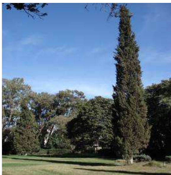
Fig.1. Jardins suburbains de l'E.N.S.A. d'El Harrach

La station retenue est sise à El Harrach. Il s'agit d'un milieu suburbain représenté par les jardins de l'Ecole Nationale Supérieure Agronomique. Ce site d'étude est caractérisé par une riche flore organisée en trois strates. La strate arborescente est composée notamment par des plantes ornementales telles que Washingtonia robusta , W. filifera , Fraxinus angustifolia , Schinus molle , Melia azedarach , Cupressus sp et Eucalyptus sp . Les deux autres strates sont l'une herbacée à Stenotaphrum americanum et l'autre arbustive (Fig. 1).