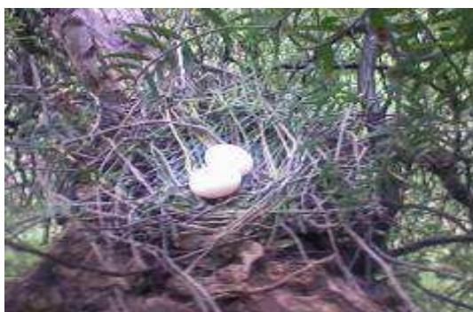
Fig. 2. Les œufs du Pigeon ramier Columba palumbus