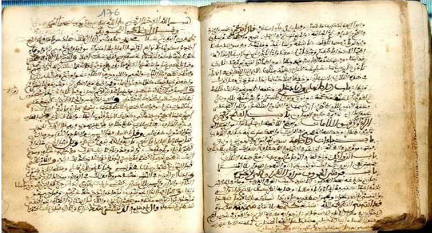
صور المخطوطتين: تبصرة الإخوان وأرجوزة في التجويد: