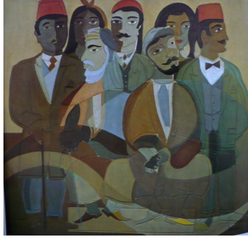
علي باللاغه، صورة عائلية، اكريليك 120x100سم 1985

لقد وجدت جماعة مدرسة تونس في الساحات العامة منفذا إلى الجمهور التونسي، و هو ما نجد أنه يتنزل في إطار التسويق والإشعاع وتحقيق السند الجماهيري الكافي، الذي من شأنه أن يدعم نفوذ هذه الجماعة ويفرض تأثيرها على الممارسات الجديدة و على النشاط الثقافي المحلي بصفة عامة.