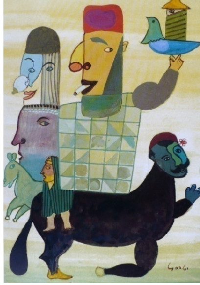
عبد العزيز القرصي "الجربية"، قواش على ورق، 50x65 صم، 1972

وفيما يتعلق بمقومات العلاقة الفاعلة والمتفاعلة بين الفنان وجمهوره يورد الناصر بن الشيخ التناول الأنسب لإنجاح هذا التواصل حيث يفيد الأتي "فعملية الخلق الفني وما يتبعها من طرح أسئلة مختلفة ترتكز قبل كل شيء على الحوار بين ما يقدمه الفنان من الإعتبارات الجديدة ورد فعل الجمهور والنقاد. ولكن من الطبيعي أن تكون أداة تبليغ موحده ويتفق عليها من طرف الجميع حتى يقع الحوار... وأداة التبليغ هذه تتمثل طبعا في النظر إلى العمل الفني عن طريق التحليل الحقيقي والموضوعي لا عن طريق الأحكام المجانية والشخصية. وككل حوار يدور حول موضوع معين فإنه لا يتم ولا يأتي ثماره إلا إذا كان جميع المشاركين ملمين بكل جوانب هذا الموضوع. ولا يتم هذا الحوار إلا إذا كان الجميع متفقين على حد أدنى من الفهم الحقيقي والمركز للعمل الفني ويجب أن يضم هذا الحد الأدنى معرفة أجدية البحث الفني على الأقل"7 وهنا تحيلنا المسألة على قضية جوهرية تخص الممارسة التشكيلية وهي قضية النقد الفني ومنهجه التحليلي الكفيل بالقراءة الصحيحة للعمل